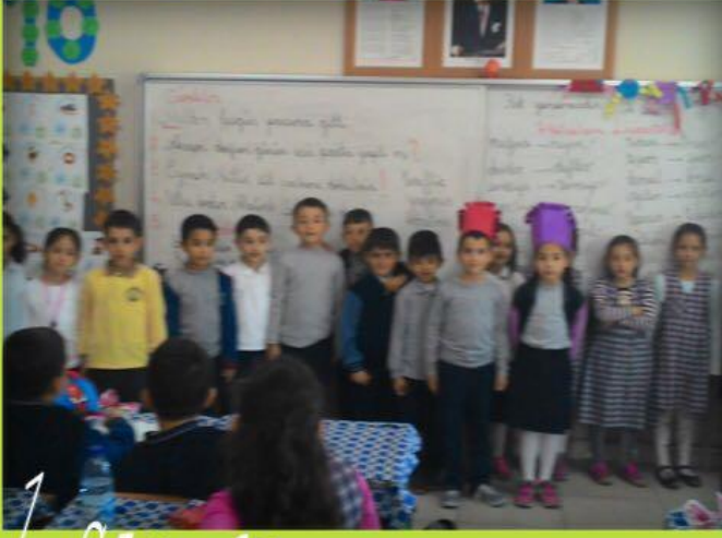
1. Sınıfların sağlıklı atıştırma ikramları